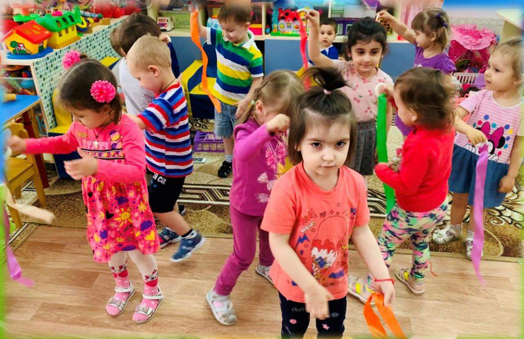
❖ «Игры с лентами»